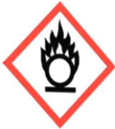
Flamme über einem Kreis