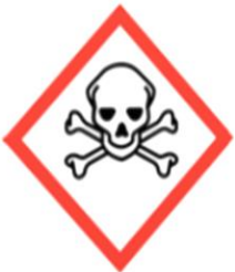
Totenkopf mit gekreuzten Knochen